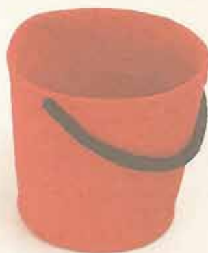
Tora Endestad Bjørkheim It's a small world, but not if you have to clean it (2010) Heking, bomul